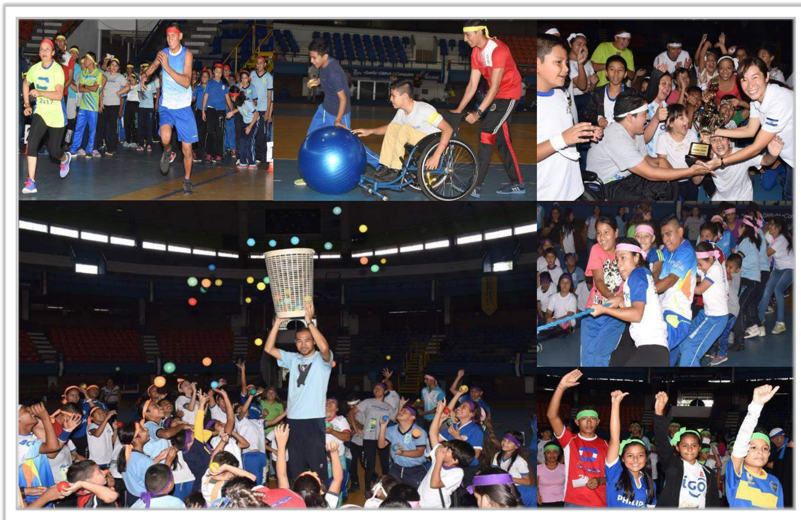
障害者と健常者が一緒にスポーツを楽しめる機会として企画した 障害者150名健常者150名総勢300名で開催した運動会