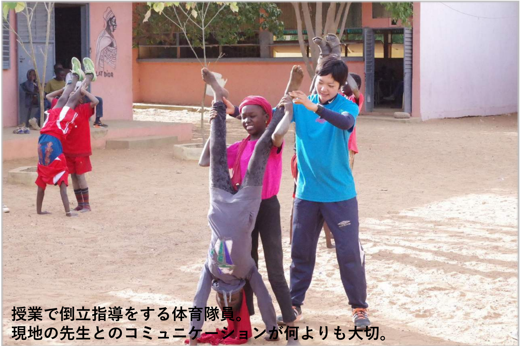
授業で倒立指導をする体育隊員。 現地の先生とのコミュニケーションが何よりも大切。