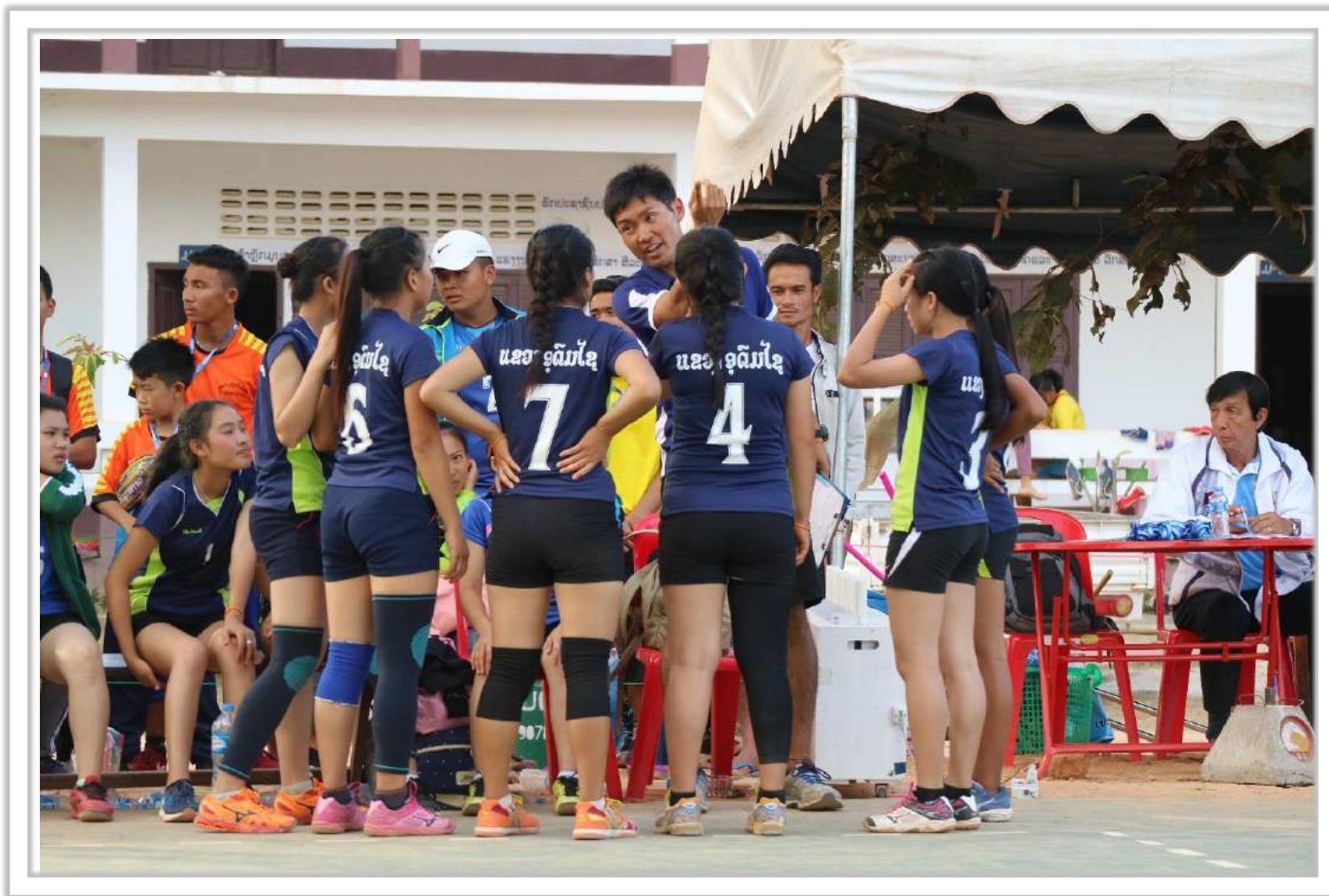
2017年3月に行われた第6回ラオス全国学生大会。 ウドムサイ県代表チームのコーチとして参加し、メダルを獲得