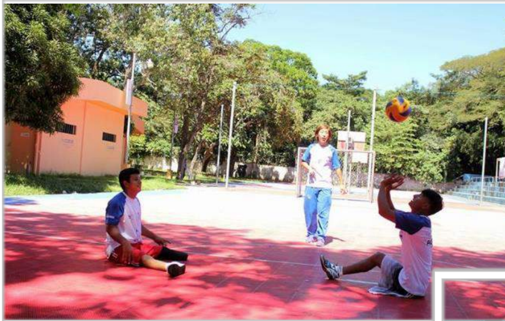
障害者スポーツのトレーニング指導 (シッティングバレーボール)

特別支援学校にて体育授業をしている子どもたちが陸上の大会に出場し、メダル及び国際大会の切符を勝ち取ったとき