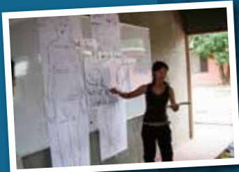
現地での指導の様子