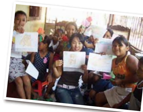
指導した子どもたちと一緒に

「飛び込むような活動を通していつも感じたのは現地の人たちの熱気。ニカラグアは貧しい国ですが、祖国を想う気持ちがとても強い。そして、次世代を支えるたくさんの子どもたちもエネルギーでした。専門家チームがいなかったからこそ、よりダイレクトに胸に響いたエピソードかも知れません」。 少子高齢化が進む故郷・小豆島を真剣に考える大きなきっかけにも繋がったと話します。