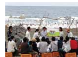
Tシャツアート展での1コマ。 大きな絵本に、子どもたちは夢中