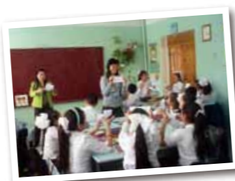
モンゴルでの図画工作の授業風景

にも社会で経験を積もうと小学校の教員を数年務めた後、協力隊に参加。モンゴルのダルハンに赴きます。