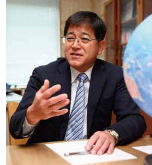
校長室には大きな地球儀。 これを使って子どもたちに 世界の話をする