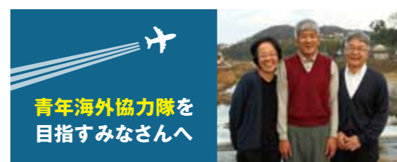
青年海外協力隊を 目指すみなさんへ