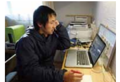
問い合わせを受け、宿泊の予約状況を確認

若葉屋を利用。地元に住んでいるからこそ知っているローカル情報が、サービスの大きな要素になったと話します。