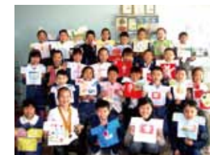
紙のTシャツアート展、のための作品づくり。子どもたちの 笑顔が原動力に