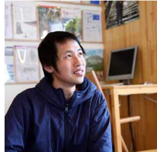
赴任時代は翻訳を通して国際文通の橋渡しも

現在はセネガル時代に知り合った同期隊員の奥さんとともに、宿主として「ゲストハウス若葉屋」を切り盛り。海外での宿泊経験を活かし、利用者の視点からサービスをアプローチします。子宝にも恵まれ、セネガルの一般的な農家と同じ自宅型の職場環境を確立。家族との触れ合いも大切にする毎日です。瀬戸内国際芸術祭が行われた2016年には、フランス人をはじめ大勢の外国人観光客が