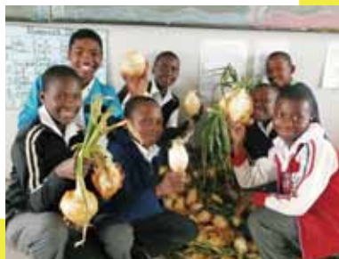
南アフリカで有機農業に取り組む▶

NGOとJICAは対話、連携、サポート等を通じて協働しています。対等なパートナーシップに基づき、より効果的な国際協力の実現と、国際協力への市民の理解と参加を促進するため、意見交換を行う「NGO-JICA協議会」や、日本のNGOをはじめ、大学、地方自治体及び公益法人の団体等が企画した途上国への協力活動をJICAが支援し、共同で実施する「草の根技術協力事業」などがあります。このような協力関係のもと、全国のネットワークNGOとJICAは、NGOを支えるための資金を広く集めることを共通の目的として、ネットワークNGO独自の募金活動とJICA基金の拡充を図るために、このたび共同で寄附キャンペーンを行います。