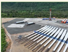
ラオス 建設が進む風力発電設備