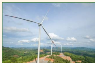
ベトナム 稼働中の風力発電