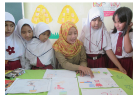
インドネシア教科「環境」導入プロジェクト