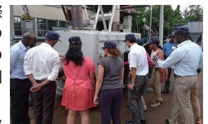
製品(炭化装置)を用いた金沢市の企業での研修の様子

JICAでは、民間企業との連携強化を図り、途上国の開発課題の解決と企業の海外展開活動の促進に資するため、ODAによる支援事業を行っています。JICAの国際協力経験やノウハウ、途上国との人的ネットワーク、約100カ所の海外拠点を活用し、途上国の貧困削減や経済成長に資する技術・製品を有する企業の進出を後押しします!