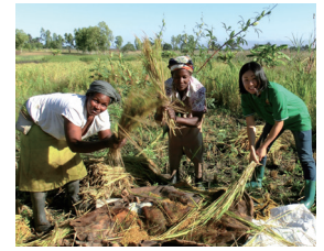
現地の人と活動する青年海外協力隊員