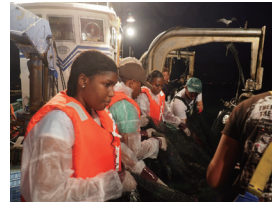
定置網漁を体験する研修員

開発途上国の若手行政官や技術者等*を日本に招き、国の未来を担う人材を育てる事業です。知識・技術の習得のみならず、地域の方々との意見交換やイベントにも参加し、交流を深めます。