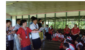
教師海外研修で現地の学校を訪問する教員たち

JICAは多文化共生・国際協力が当たり前で身近に感じられる社会を目指しています。開発途上国に関する「知見の還元」、自分に何ができるかを「考える機会の提供」、地域での国際理解教育推進のための「橋渡し役」、を3本柱に、JICA北陸は出前講座や教師海外研修など様々な支援メニューを用意しています。