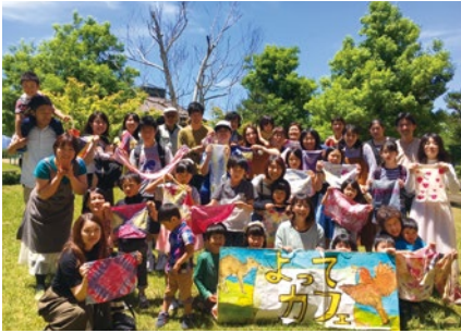
養護学校の卒業生のために開設した『よってカフェ』。今では、障害や問題の有無を超えて地域の老若男女が集まる場になっている。