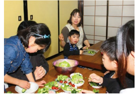
3歳から中学生までが通う『あおむし』では、料理などの生活スキルを覚えることで、人との関わり方やルールを身に付けていくという。

の子どもたち。同僚や子どもたちと3か月かけて完成させた壁画は地元新聞でも紹介され、地域の人たちに子どもたちの創作活動を見てもらえる場になり、養護学校のイメージアップにも役立った。「こうした活動を続けるためにも、自分たちで資金を稼ごうと考えました。雑誌のページを三つ折りにしてバスケットを作ったり、粘土で花瓶を作ったり……おかげで子どもたちの創作意欲もだんだん向上していったんです」