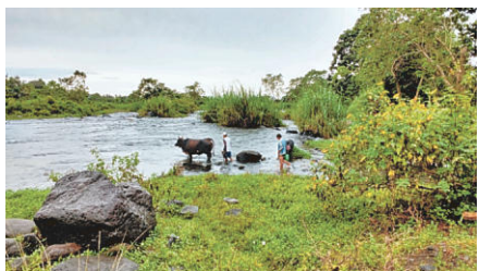
町役場近くで橋のない川を渡る住民