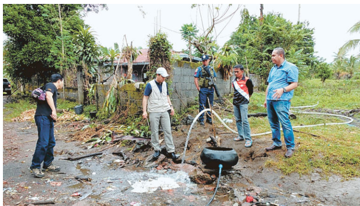
町役場近くの給水施設を見せる町長と住民

大小7000を超える島からなるフィリピンで、2番目に大きい島・ミンダナオ島では、一部の地域で長い間、反政府グループとフィリピン政府とが戦っていました。2014年に和平合意が結ばれましたが、長期にわたる紛争の結果、島の南西部には開発が遅れている地域があります。そこでは政府がきちんと動いておらず、住民は生活に必要な「公共サービス」が受けられていません。日本では、水道や電気、図書館やバスなどの公共サービスは「あるのが当たり前」ですが、ミンダナオ島では、無いところが多く、住民の不満も募るばかりです。