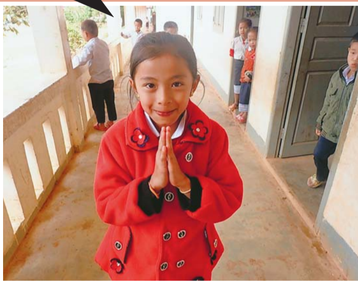
「サバイディー」。両手を合わせてあいさつをします