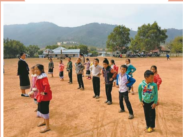
休み時間に体操をします。女子はラオスの民族衣装で伝統的な巻きスカートのシンを着ています