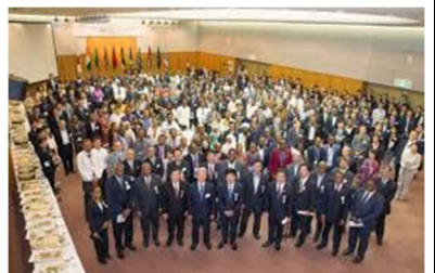
アフリカの若者のための産業人材育成（ABE）イニシアティブによる留学生