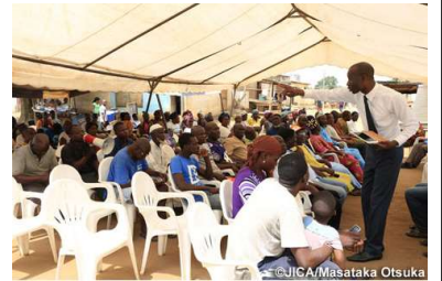
技術協力「大アビジャン圏社会的統合促進のためのコミュニティ支援 2」