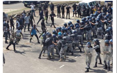
技術協力「国家警察能力強化支援プロジェクト」