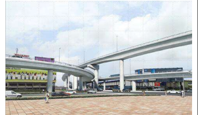
無償資金協力「日本・コートジボワール友好交差点」