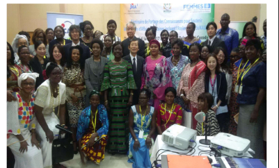
女性企業家 5S/KAIZEN セミナー, 2017