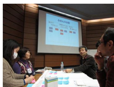
【全体会】分科会で学んだことをもとに、地球のためにできることを3つの分類で考える(2013年)