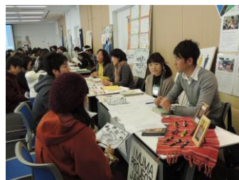
「ボランティア・インターンマッチング展」の様子(2012 年)