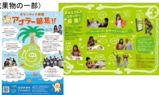
研修にて作成されたボランティア募集パンフレット