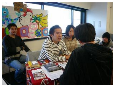
研修のうち「実践・反響調査」の現場