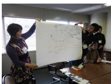
【分科会】森林破壊の原因と結果について考えた結果をほかのグループに共有(2013年)