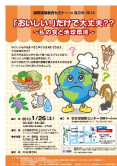
第12回(2013年)セミナーのチラシ