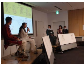
NGO スタッフ、JICA 職員を交えた「国際協力大学」シンポジウム(2012 年)

中部地域を中心に、イベントや大学等にて配布されたパンフレットとプログラム内容。(本事業にてマッチングが成功し、現在、ボランティアやインターンとして活躍している「参加者の声」を掲載している)