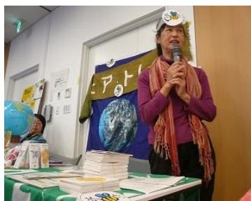
「国際協力カレッジ」の様子