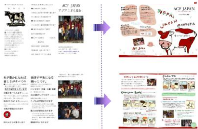
研修作成前のパンフレット(左)、研修作成後のパンフレット(右)