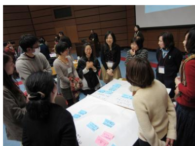
【全体会】ほかのグループの意見も見て回ろう(2013年)