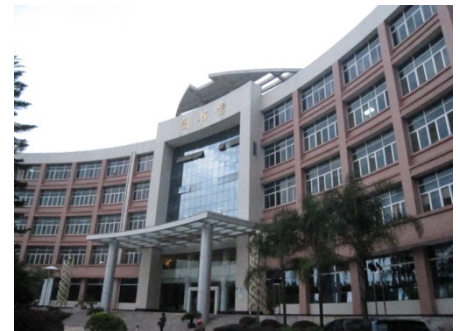
本事業で建設した桂林医学院 図書館