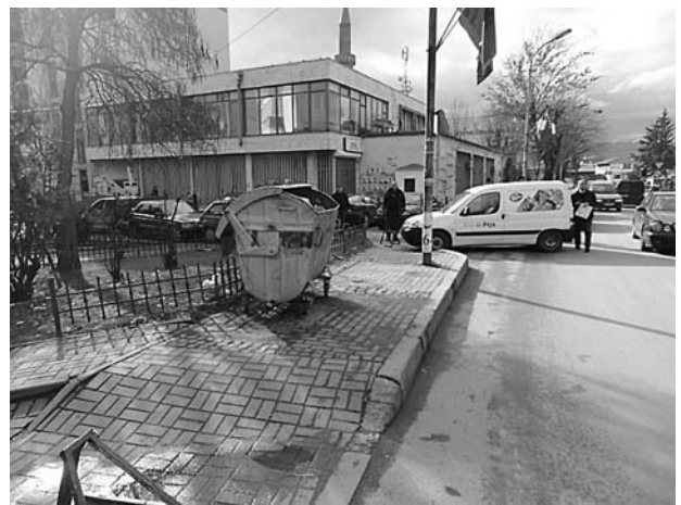
図-5 現在のプリズレン市の状況 図4と同地点 ごみの不法な投棄がなくなっている (2014年)

これらの取り組みによって、制度面および実施面の両面から、プリズレン市における廃棄物管理能力の強化が図られてきている。これまでに、①廃棄物管理計画の策定と議会承認、②廃棄物収集率の向上、不法投棄の減少(図-5)、収集地域の拡大(プロジェクト開始時には全76地域中53地域を対象としていたが、現在は73地域まで拡大)、③プリズレン市に廃棄物管理課の設置といった成果を出している。