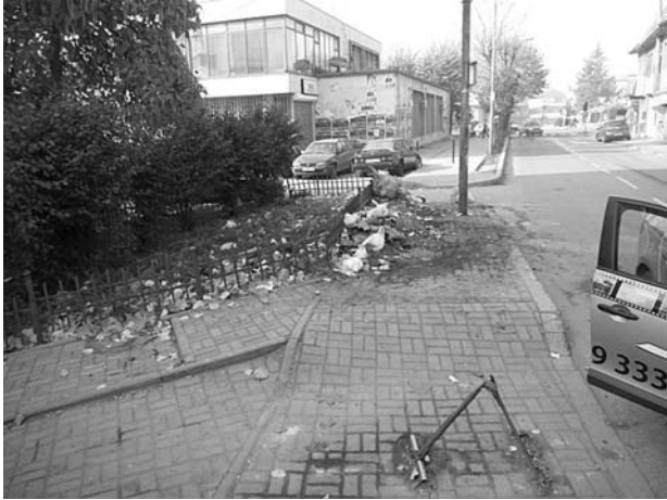
図-4 プリズレン市におけるごみの投棄状況 (2011年)

排出量が増加するごみに対し、収集・運搬が追い付いていない。また、住民のごみ処理に対する意識も醸成されておらず、プロジェクトの開始時には街の至る所にごみが不法に投棄されていた(図-4)。