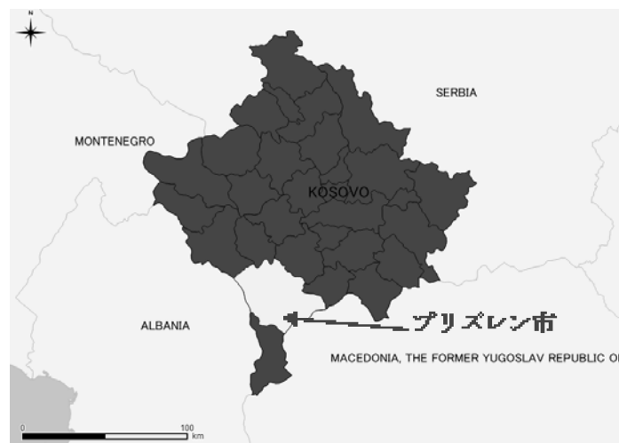
図-2 コソボ国内におけるプリズレン市の位置

系統立った廃棄物管理計画の不備と計画的な廃棄物管理実施の経験不足から、近年の人口増加に伴い