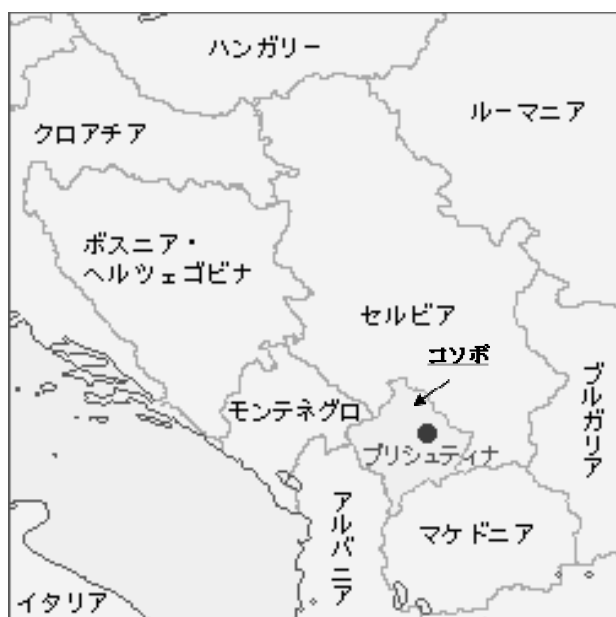
図-1 コソボと周辺諸国

コソボ共和国(以下コソボ)はバルカン半島中部の内陸部に位置し(図-1)、旧ユーゴスラビア社会主義連邦共和国を構成するセルビア内の自治州であったが、1990年代のコソボ紛争を経て、2008年にセルビアからの独立を宣言した新しい国家である。同国の経済や社会はこれまでセルビアに大きく依存してきたため、独立後の経済・社会基盤は脆弱でバルカン地域における低開発地域となっている。日本は独立後間もない2009年には外交関係を樹立し、以降ODAを通じた支援を実施してきており、近年は要人往来といった交流も頻繁に行われるようになってきている。