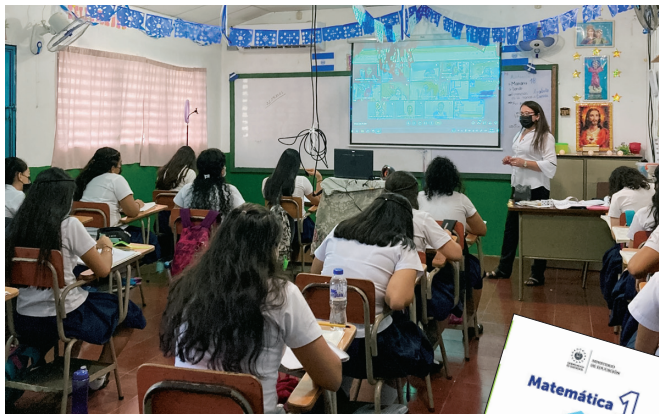
上：コロナ禍で対面と遠隔授業を同時に実施。右：デジタル化されたエルサルバドルの算数の教科書。日本にいるスペイン語話者の児童への活用も行う。