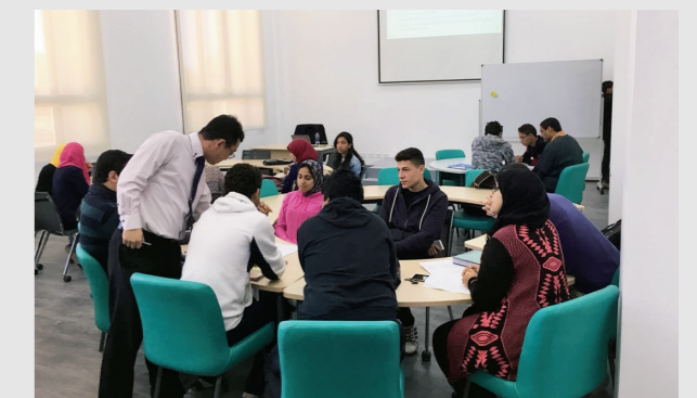
JICAが工学系大学院の基盤強化と工学部および国際・ビジネス人文学部の運営を支援するエジプト日本科学技術大学(E-JUST)。

このため、TVETの分野でも、企業との連携や広域展開を進めながら、人材の育成に取り組んでいます。