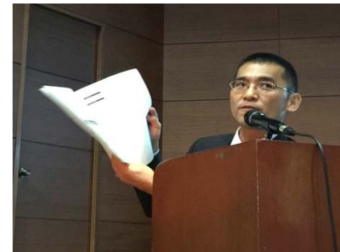
Expert Seminar 又地専門員の発表