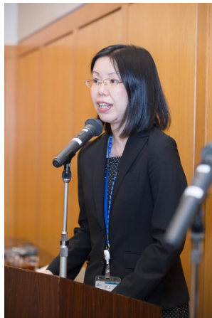
ABEイニシアティブ第1パッチ激励会 (9/19)のMCを務めました

前号の事業紹介で、高等教育案件を3件取り上げましたが、中身もアプローチも異なっており、一口に高等教育支援といってもバラエティに富むことがわかりただけだと思います。2008年10月の新JICA発足以来、例えば、円借款や無償資金協力による施設・機材整備と技術協力による研究・教育能力強化を、案件の形成段階から(当然のように)包括的に検討できるようになりました。事業の実施においても日本の大学の知見やノウハウを十二分に活かすやり方は、他の援助機関と比較して、JICA協力の付加価値・ブランディングに繋げていけるのではないかと考えています。また、ABEイニシアティブ(詳細は前号をご一読ください)のような、産学官連携の具体的なプラットフォームをJICAが有することになったのも、新たな強みになると確信しています。現在の高等教育、職業訓練・技術教育にかかる協力は、日本の外交政策や教育政策、産業界の意向などとも深く関係するため、いろいろな交通整理も必要となりますが、事業を俯瞰的な視点で捉え、社会へのインパクトを考える醍醐味があります。これからもそのような気概をもって、グループ一丸となって取り組んでいきたいと思っています。