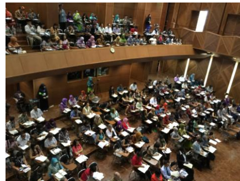
Plenary Session 2階まで埋まる

授業研究の最先端の研究者が一堂に会する本学会で、JICAの支援内容や存在感、グローバルな事業を認知させることは意義がとてもありました。また同時に、授業研究による教育の質の向上について学ぶこともでき、この経験は今後の基礎教育分野での授業研究のさらなる展開へと活かすことができます。