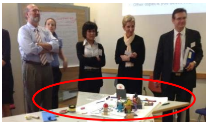
「学校運営」グループ: 地域との繋がり、学校間の繋がりを現している。

このワークを通じて、政策から現場レベルまで、お互いのリソースを持ち寄り、協力しながらインクルーシブな状況を達成していこうという思いが参加者間で共有されました。