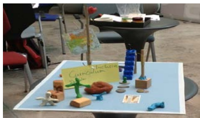
「教えと学び」のグループ: 多様な生徒がいる教室に保護者等コミュニティのサポートを得てインクルーシブな状況を一歩ずつ作って行こうとする様子を現している。