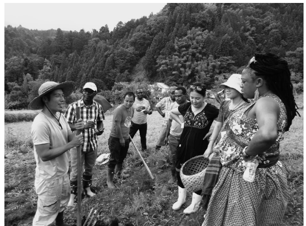
地域活性化に取り組む山梨県の若手農業者の畑で実習を受ける研修員

在外研修は、途上国間の南南協力を日本が第三国で実施する「第三国研修」 ●2 と、研修実施国でその自国民を対象として実施する「現地国内研修」に分類される。在外研修の特徴として、実施場所と参加国の社会・経済または自然環境が比較的近いため、