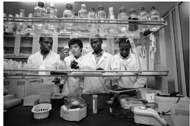
ガーナにおけるSATREPS案件(ガーナ由来薬用植物による抗ウイルス及び抗寄生虫活性候補物質の研究プロジェクト)

対応国際科学技術協力」(SATREPS: Science and Technology Research Partnership for Sustainable Development)が始まった。