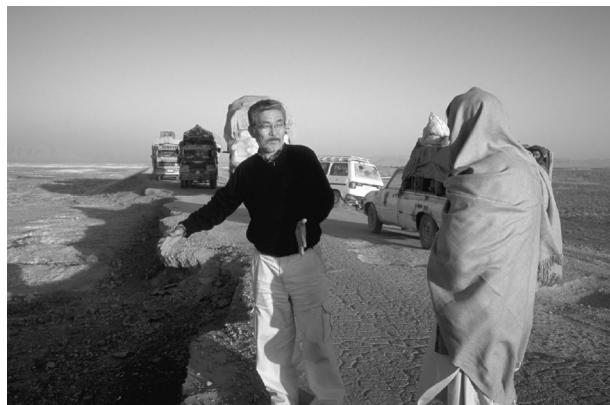
アフガニスタン・カンダハールの道路を現地踏査する専門家

2008年10月の新JICA発足以降、それまで「開発調査」と呼ばれていた事業が「開発計画調査型技術協力」と「協力準備調査」の2種類の調査に分かれることとなった。具体的には、将来の有償資金協力および無償資金協力の協力案件の形成や事前準備としての性格を有する調査は、国際約束の不要な協力準備調査と整理した。他方、開発調査のうち、途上国への技術移転やカウンターパートとの密接な共同作業が必要な政策立案または公共事業計画策定、マスタープラン策定や、パイロット事業が含まれるようなものは、国際約束が必要な開発計画調査型技術協力として取り扱うこととなった。