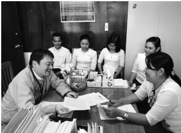
ミャンマー投資企業管理局で助言を行う専門家

従来、専門家派遣では、関係省庁に専門家候補者の推薦を依頼するケースが多かったが、1997年度からは専門家の公募を実施している。1999年8月に外務省によりODA中期政策が策定され、JICAでは2000年1月に地域部が設置されたことにより、開発途上国それぞれの開発課題とともに、従来以上に人材育成や制度、政策などのソフト面での協力を重視し、多様なメニュー（個別専門家、プロジェクト方式技術協力、チーム派遣、研究協力、重要政策中枢支援、第三国専門家 ●3 、開発パートナー事業、国民参加型専門家など）で対応できる体制となった。